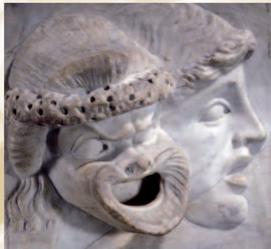
Illustration de couverture : bas-relief de masques de théâtre - Haut-Empire romain - Marbre blanc - Londres, British Museum